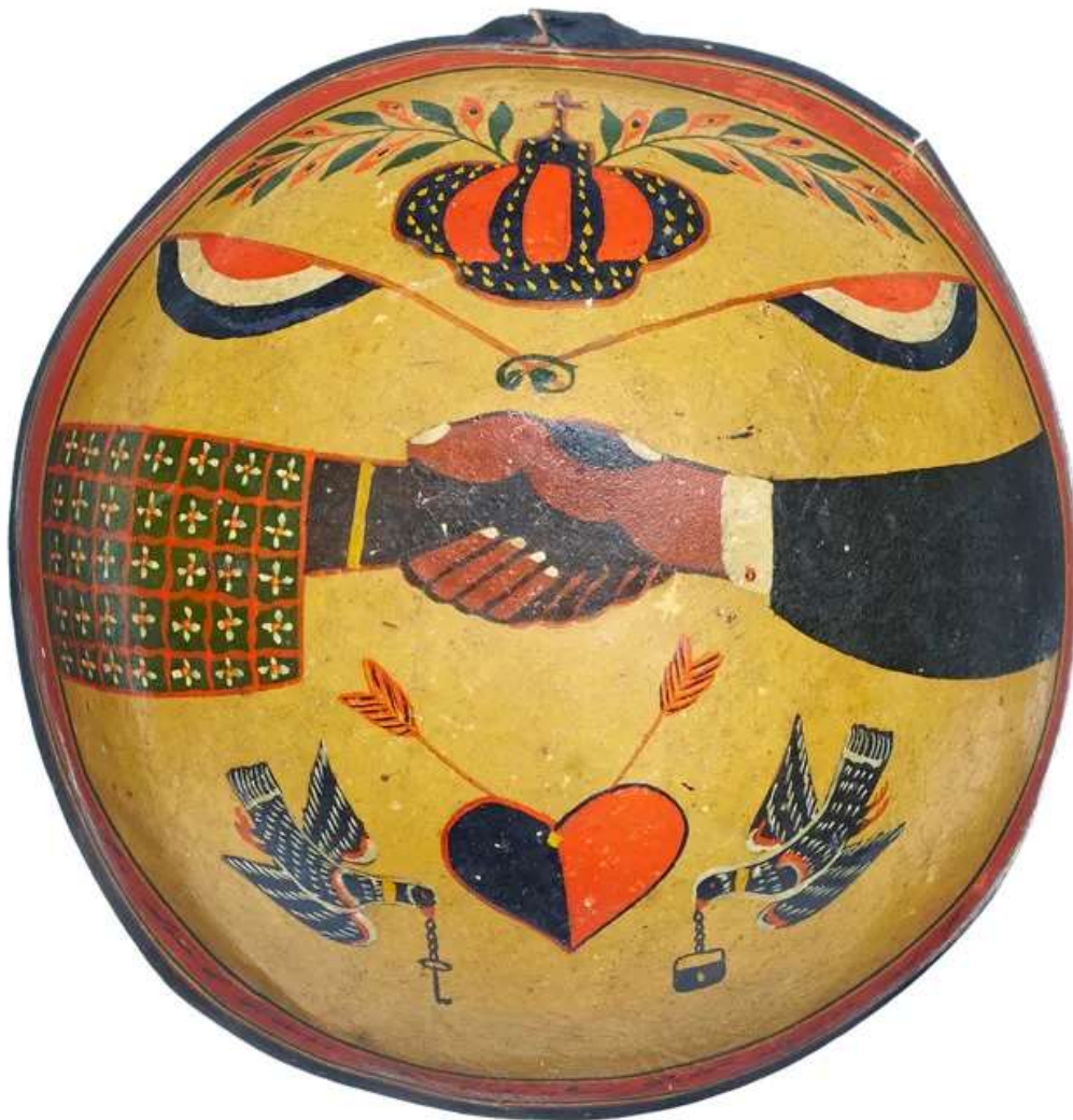
Photo : Récipient décoratif - Suriname - fin 19 e siècle - MEG Inv. ETHAM 003534