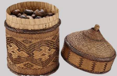
Photo : Panier du royaume Kongo – 18 e ou siècles précédents - MEG ETHAM K000252

ATTENTION : Merci d'utiliser uniquement le QR code ou l'IBAN envoyé ci-joint pour effectuer votre don ou paiement de votre cotisation.